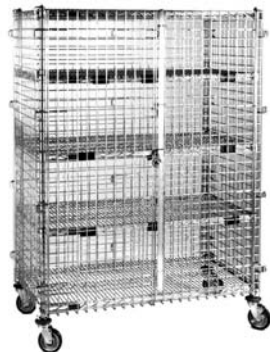
Unidad de seguridad móvil de tamaño grande con estantes centrales opcionales