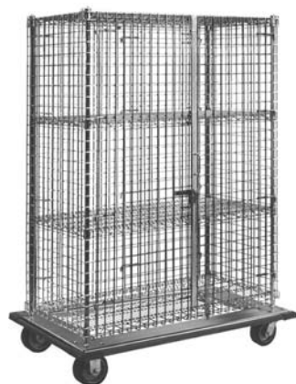
modelo de tamaño grande con plataforma móvil y estantes centrales opcionales