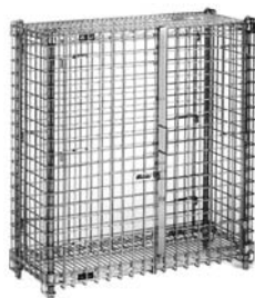
Unidad de seguridad pequeña